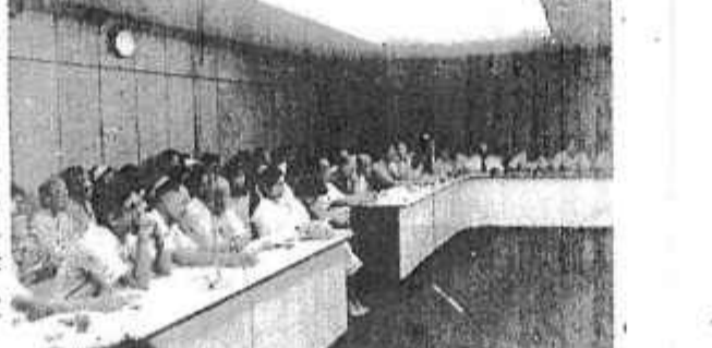
本社第二次宗教學術研討會之一角

代表西方宗教的是基督教，基督教的重心是上帝，一個有具體人格的對象，要求大家把信仰寄托在上帝身上，上帝是宇宙的創造者，是人類一切生命的主宰。其過去的權威是延伸到現在，擴展到無限的將來，直到世界末日的最後一刻。